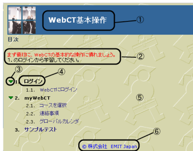
図 2 : コンテンツモジュールの目次画面カスタマイズ例

目次画面で追加、編集などカスタマイズを行えるのは次図(図2)で番号がついている場所です。