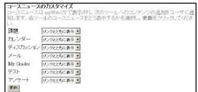
図 1 コースニュース設定画面。(デザイナー)

通常コースを追加した時、myWebCT のコースニュースの表示設定は「リンクとともに表示」になっています。