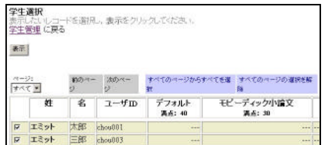
図 5 学生管理のユーザレコード一覧画面