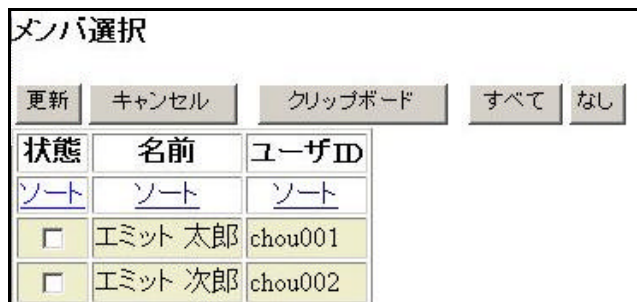
図 4 ユーザレコード一覧画面