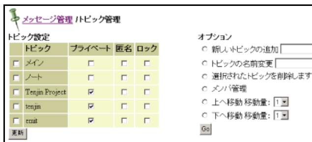
図 1 トピック設定画面